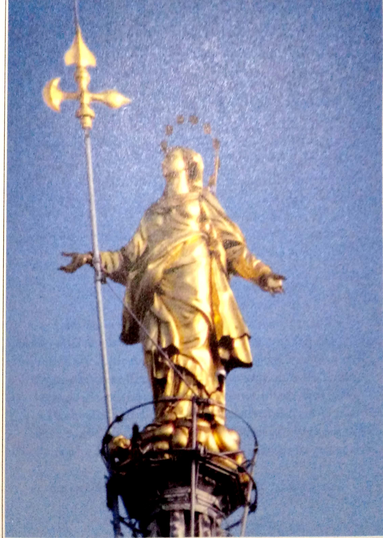
La Madunina, Milão, Itália