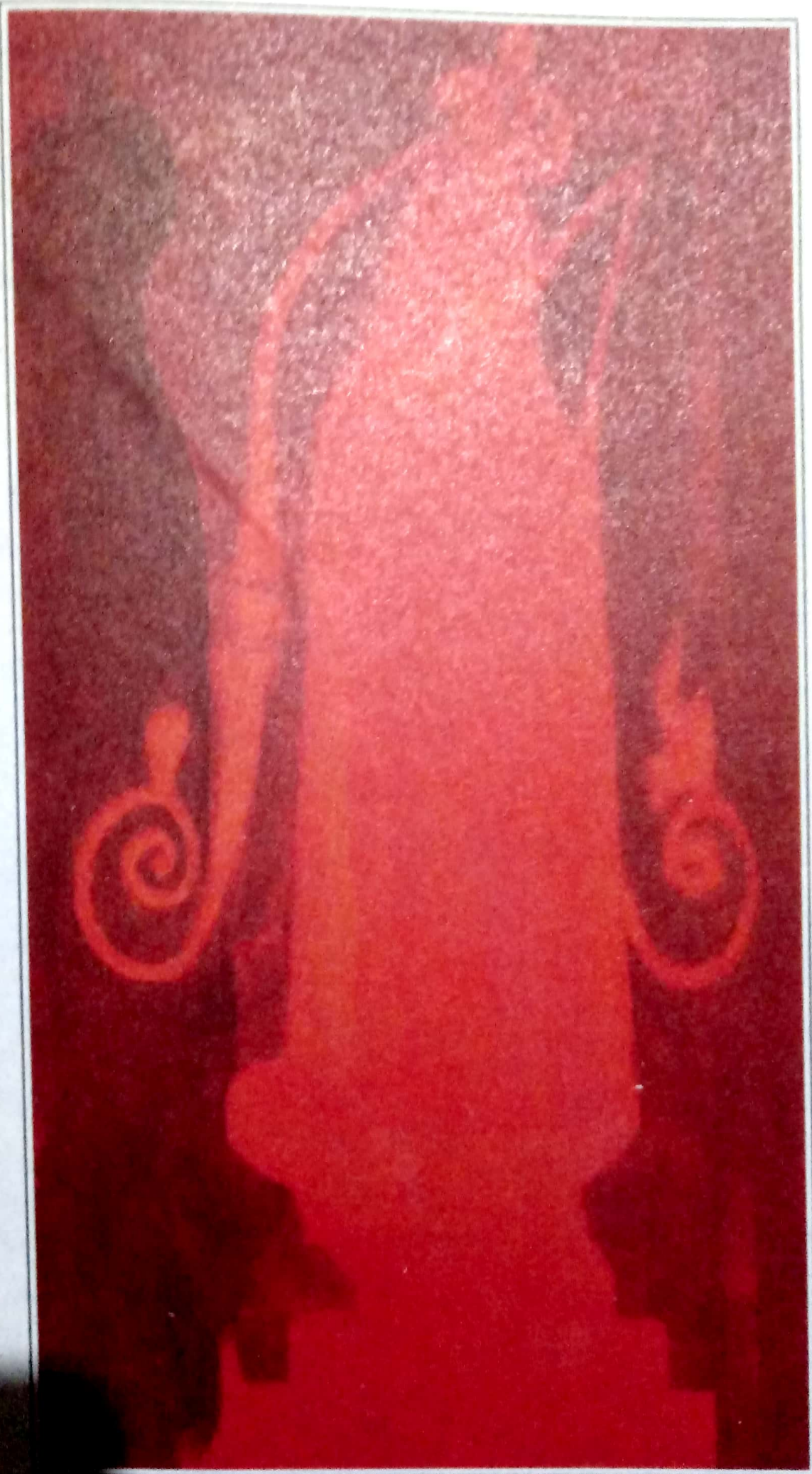
Nossa Senhora do Lago-Mãe Michigan